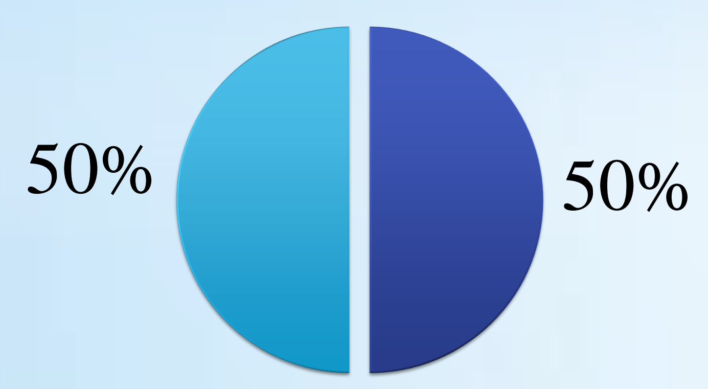
Динамика матерей 2 группы