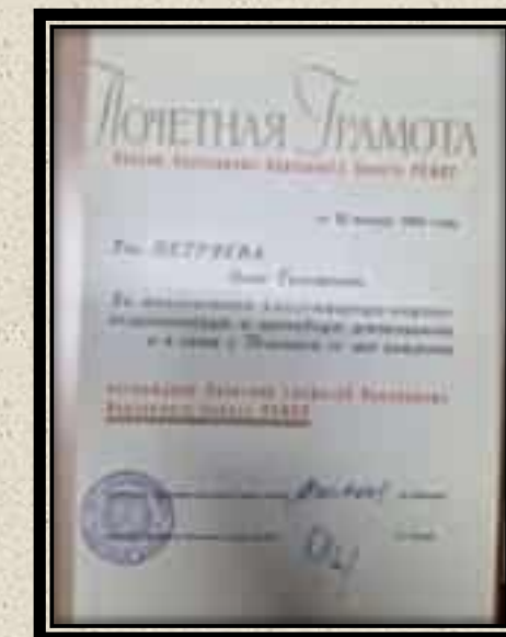
Рис 5. Награды проф. А.Т. Петряевой